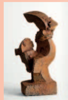
Abbildungen: Illustrations: Jörg Bach albertrichard PFRIEGER Heiko Herrmann