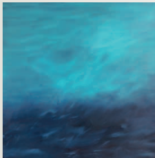
Abbildungen: Illustrations : Dieter Krieg Anton Hofmayer Leopold Kogler Raymond-Émile Waydelich Gabriel Mazenauer Susanne Zuehlke