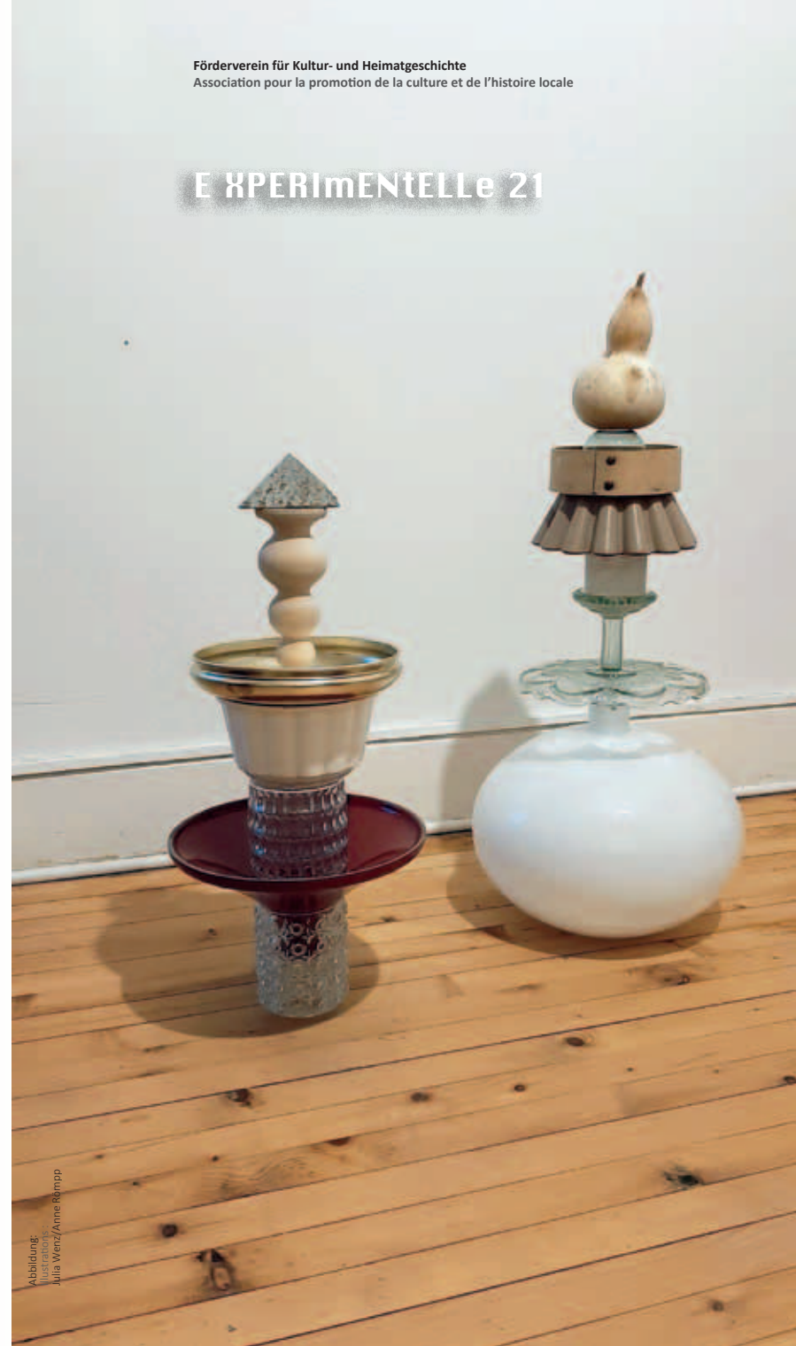
Abbildung: Illustration: Julia Wenz/Anne Römpf